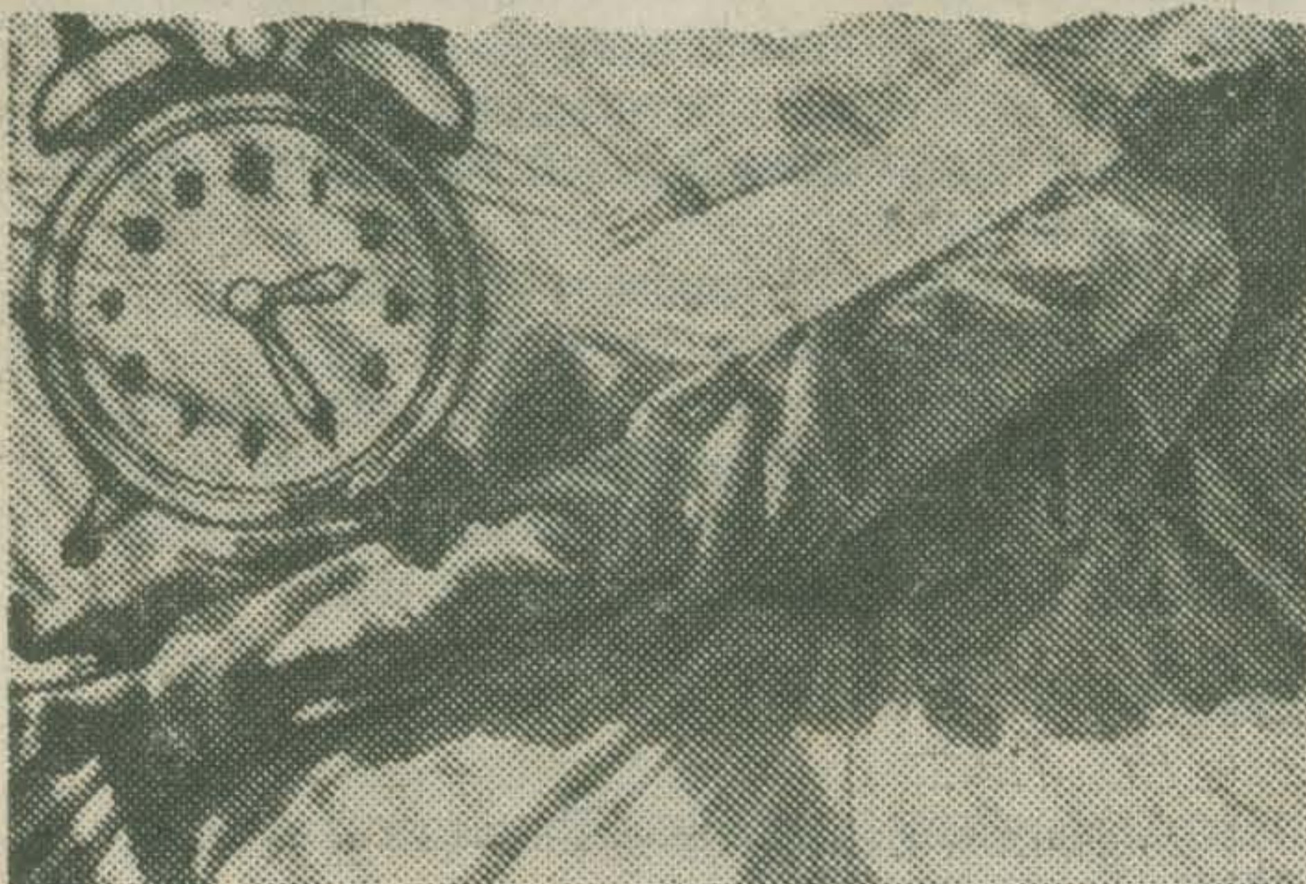
BEYOND THE TIMES FORSEEN (Jeanne C. Finley)

Beyond The Times Forseen Volgens een dik-hout-zaagt-men-planken methode wordt op typisch Amerikaanse wijze het vonnis geveld over de heiligheid van het huwelijk. Een idyllisch handboek over huwelijksgeluk en een simpel volksgebruik in Guatamala wordt geconfronteerd met tekeningen die duiden op kindermishandeling.