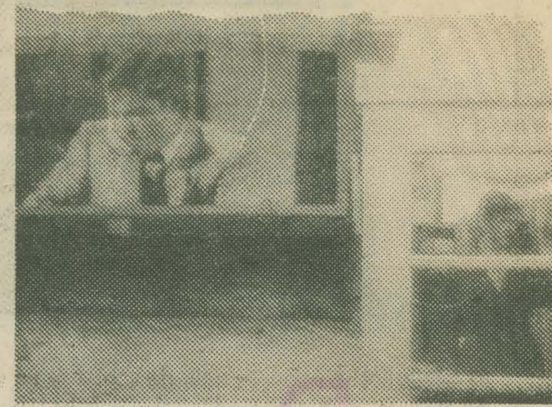
FICTION (Bernard Hebert)

Fiction Een ontvoeringsverhaal in een chique milieu met onverwachte ontwikkelingen. Nadat een vrouw is gekidnap, wordt haar echtgenoot door de ontvoerders goed voorbereid ontvangen in een hotel, waar hij meer te weten kan komen.