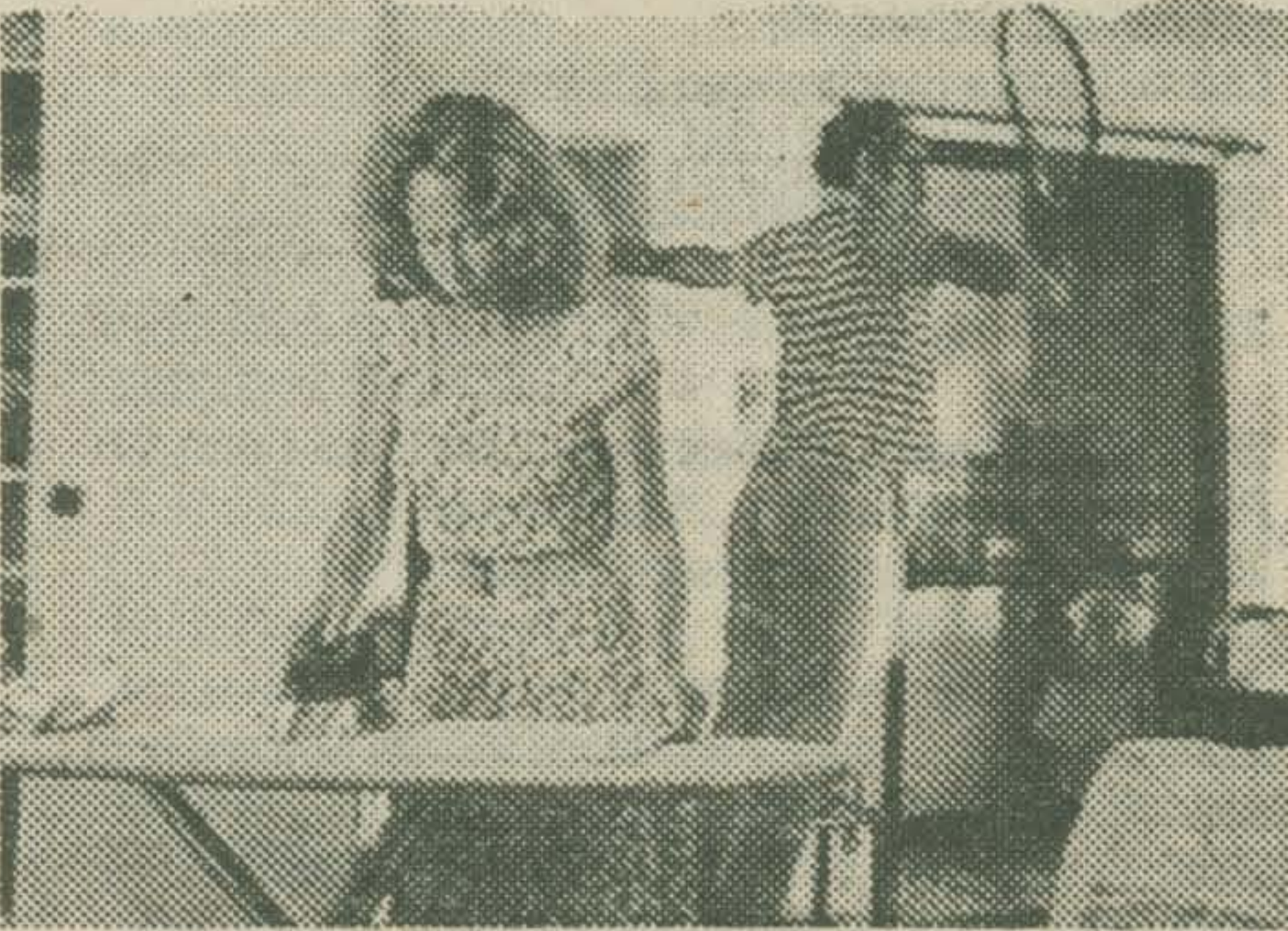
SOFT AND HARD (Jean-Luc Godard)

Soft And Hard Harde en zachte porno, hardware en software - een reflectie van Godard en Miéville op technologie en seksualiteit, de media en de routine in het alledaagse bestaan en andere dingen.