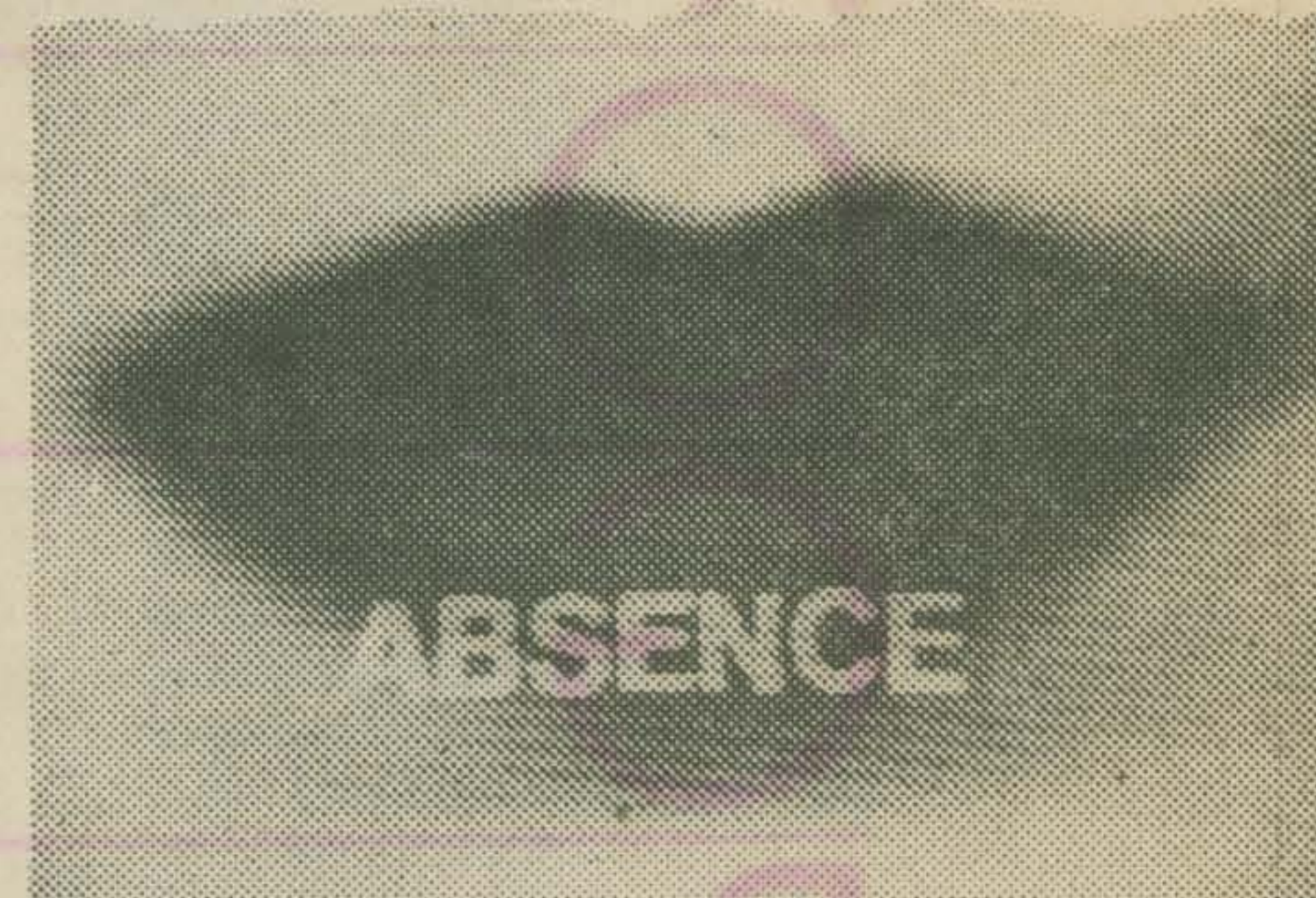
ABSENCE (Susan C. Rynard)

Een gefragmenteerd verhaal, weg van de normale percepties van tijd. Verlangen en verwachting.