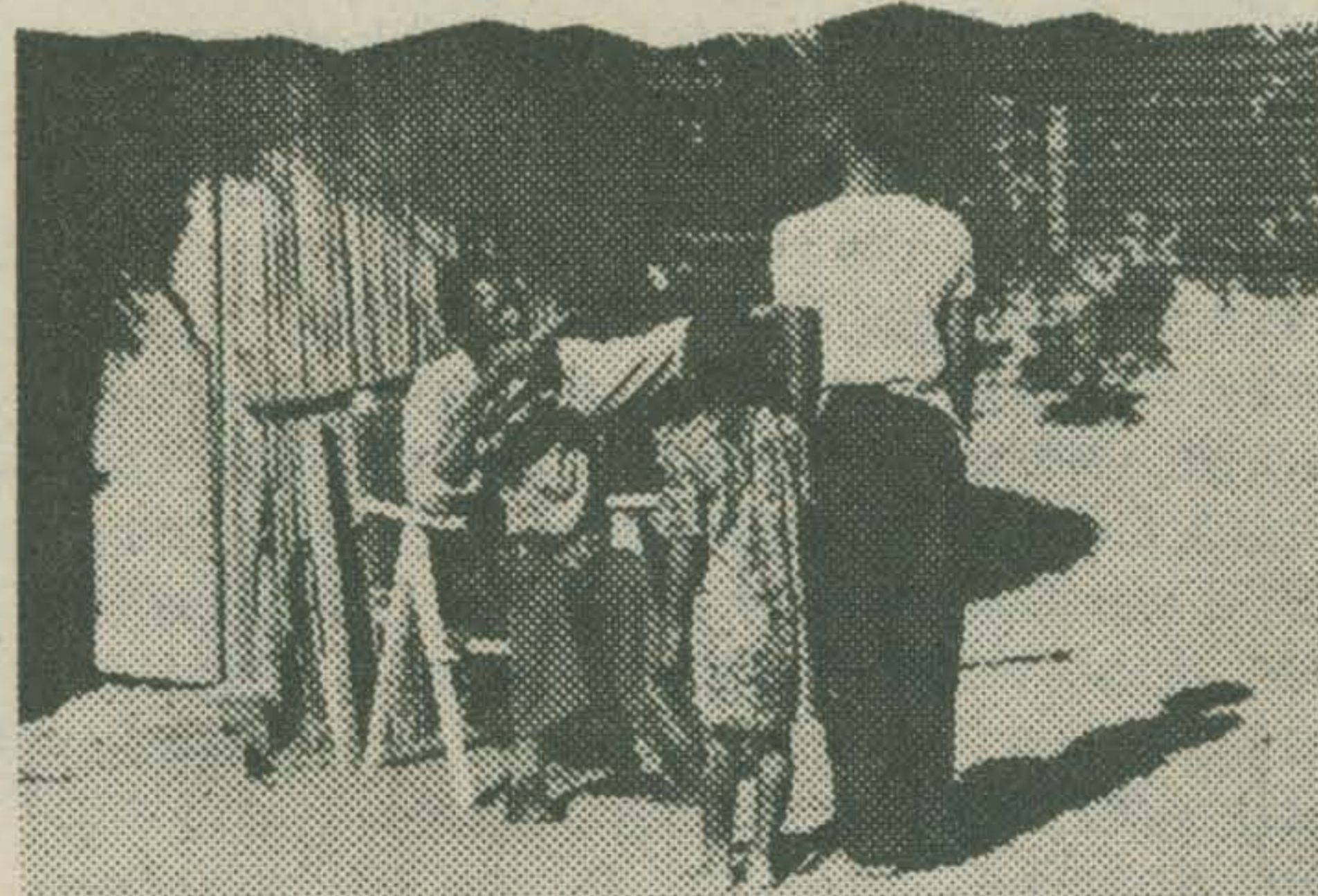
MELANCHOLIQUE (Licinio Azevedo)

LICINIO AZEVEDO (Mozambique) Melancólico In het kader van een campagne ter verbetering van de levensomstandigheden op het platteland van Mozambique een vermanende ballade over de sociale gevolgen van het verstoten van oudegeworden moeders door echtgenoten, die een beter ogende, jonge vrouw in huis nemen. De rattenvanger van Hameln in Afrika.