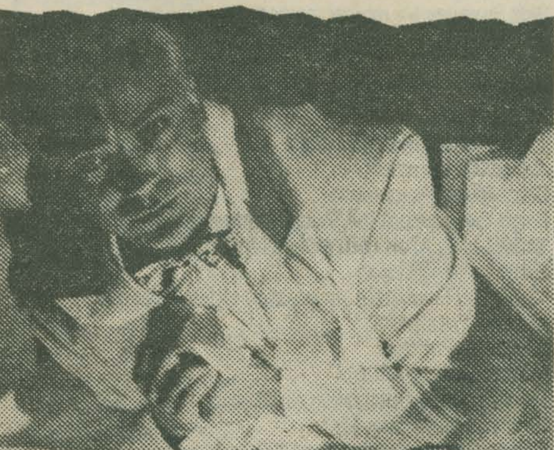
Udo Kier in AM NÄCHSTEN MORGEN KEHRTE DER MINISTER NICHT AN SEINEN ARBEITSPLATZ ZURÜCK

Am nächsten Morgen kehrte der Minister nicht an seinen Arbeitsplatz zurück Een jonge ambitieuze minister is van plan de consumptiemaatschappij te perfectioneren. Zijn ministerie moet zorgen voor een voortdurende stijging van het 'netto genot'. Geen pijn en straf meer, alleen nog beloning en lust. Hijzelf is echter fysiek niet in staat aan de eisen van dit ideale systeem te voldoen en taktelt zienderogen af.