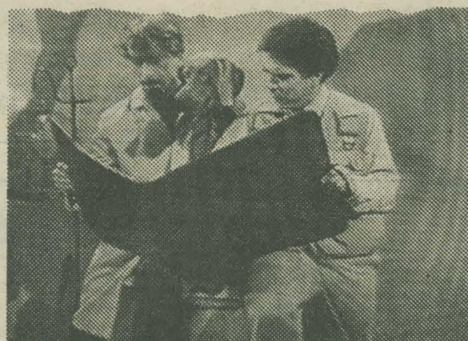
THE WORLD OF PHOTOGRAPHY (Michael Smith & William Wegman)

In deze parodistische produktie worden een amateur-fotograaf de Tien Geboden van de Fotografie ingepeperd op een wijze die sterk doet denken aan de bizarre manier waarop het medium televisie ingewikkelde onderwerpen weet te populariseren.