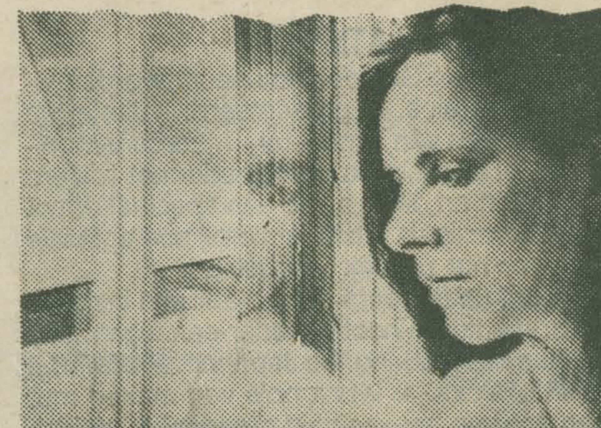
DAMNATION OF FAUST: WILL-O-THE-WISP (Dara Birnbaum)

DARA BIRNBAUM (USA) Damnation of Faust: Will-O-The-Wisp Deel van een langlopend project, waarvan in 1983 de tape 'Evocation' werd vertoond. Een onderzoek naar de dualiteit tussen innerlijkheid en omgeving, teneinde gewone, banale handelingen te voorzien van een indringender en vollediger betekenis. Vanuit een bovenkamer kijkt een vrouw door het raam naar de mensen op straat.