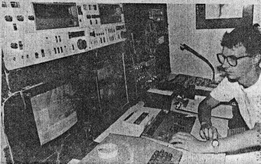
El video-artista inglés Jeremy Welsh.

Jeremy Welsh es de Londres, tiene 31 años y en definitiva es muchas cosas más: diseñador gráfico, organizador de las exhibiciones de London Video Arts. Es músico y escritor, además es el ganador del Festival Interna-