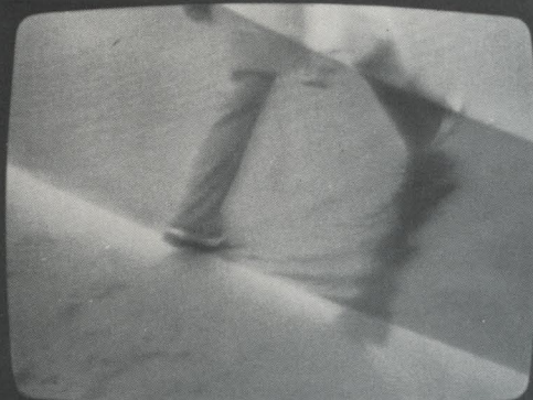
« Camminare sull'acqua » 1975