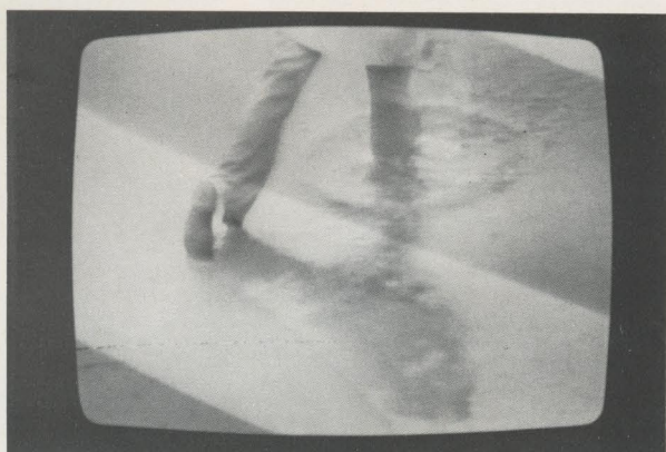
« Camminare sull'acqua » 1975