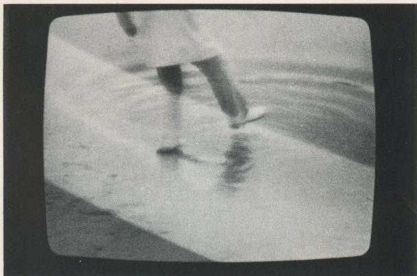
« Camminare sull'acqua » 1975